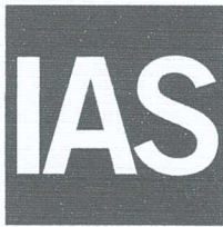
King Cert International Certification Ltd. Director

ACCREDITED Management Systems Certification Body MSCB-196